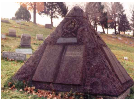
这个罗素纪念碑 是由守望台按照金字塔的样式竖立建造的。

Russell (查尔斯·罗素) 预言耶稣将在 1874 年隐形显现。但圣经清楚明白地教导, 基督的再来只有一次, 在他名为《锡恩的守望台》的杂志里, Russell 说耶稣基督在地球上的隐形显现会在 1874 年的 10 月开始, 并且会持续到 1914 年, 到那时候异教徒国家都会被毁灭!